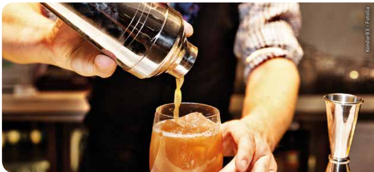
Kondor-B3 - Fotolia