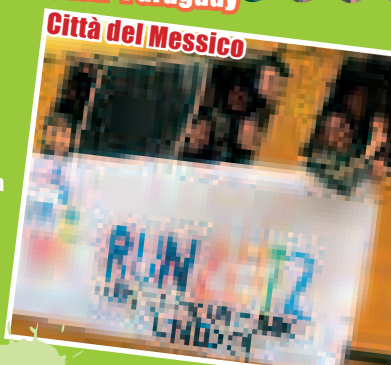
Città del Messico