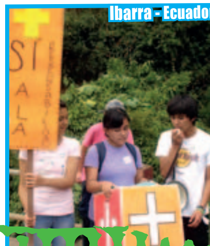
Ibarra - Ecuador